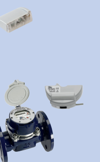
UBIN Grosswasserzähler mit Systemmodulen