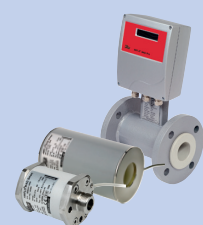
Magnetisch induktive Durchflussgeber