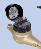
aquabasic® Hauswasserzähler mit Systemmodulen